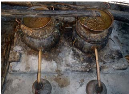
Figura 16. Detalle de los cazos de cobre. Santa María Ixcatlán, Oaxaca.