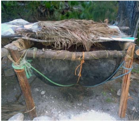
Figura 11. Tina hecha con cuero de res para fermentar los mostos obtenidos al triturar las piñas cocidas de maguey papalomé-potatórum.

gos extraídos como el bagazo se vacían en pieles (cueros) de res, donde posteriormente son mezclados con agua. Los cueros de res pueden ser cubiertos con hojas de palma, con láminas de marcolita o con plásticos (figura 11).