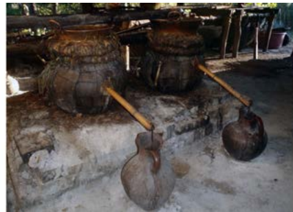
Figura 17. Detalle de las monteras. Santa María Ixcatlán, Oaxaca.

El licor que se obtiene de la primera destilación es llamado “llanito” por los ixcatecos, caracterizado por ser de baja calidad. Para refinarlo se pasa por el mismo proceso, es decir, segunda destilación, y, para obtener un mezcal de mayor calidad, se le pueden añadir más mostos e, incluso, trozos de maguey cocido (figura 17).