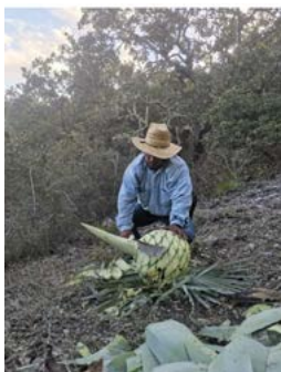
Figura 2. “Despencado” o limpia del maguey. Santa María Ixcatlán, Oaxaca.

De esta manera, tanto en Ixcatlán como en Santo Nombre, el maguey se busca y se recolecta en los montes de las comunidades. Los magueyes seleccionados deben estar maduros para que la cantidad de azúcares contenidos en su interior permitan un rendimiento óptimo al momento de su destilación. Así, mientras que en Ixcatlán pueden cortarse magueyes “macizos” y “capones” (plantas cuyos troncos o inflorescencias también conocidos como “quiotes” les fueron cortados al momento de que le comenzaron a brotar para reproducirse) en Santo Nombre Castellón y Pérez (2015) no dejan muy claro cuáles son los magueyes adecuados para la obtención de mezcal, ya que comentan que un maguey “castrado” imposibilita su uso y que si el quiote apenas le está saliendo, “aunque el maguey sea grande [...] es muy posible que se pudra antes de fabricar el mezcal”.