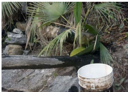
Figura 19. Detalle de las pencas de maguey y los troncos usados como canaletas para transportar el agua de manantial que enfriará las monteras de los destiladores.

La destilación en Santo Nombre se realiza, según lo descrito por Castellón y Pérez (2015), en uno o dos destiladores que constan de un tonel de lámina en donde se hierven los jugos y una olla de barro invertida que funciona como montera. Los toneles se colocan al interior de una estructura completamente similar a la descrita en Ixcatlán, tanto en forma como en dimensiones, excavada y construida de la misma manera. Asimismo,