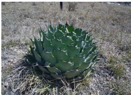
Figura 1. Maguey papalomé-potatorum. Santa María Ixcatlán, Oaxaca.

Como anteriormente se mencionó, el mezcal de las comunidades que aquí se comparan se elabora con un maguey silvestre científicamente conocido como Agave potatorum denominado papalomé en la comunidad, y en la localidad poblana se elabora con el mismo maguey, pero aquí lo denominan papalómetl (Figura 1).