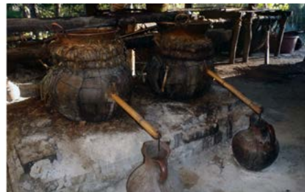
Figura 14. Hornalla. Santa María Ixcatlán, Oaxaca.

Sobre cada una de las dos ollas colocadas al interior de las hornallas se colocan otras ollas cortadas por su parte inferior (unidas y selladas con una especie de pasta de fibras para que no se fuguen los vapores y asegurar que no haya filtraciones), dentro de las cuales se pone un trozo de penca de maguey cimarrón, que los pobladores denominan “paleta”, que es la que funciona como batea o receptáculo de los vapores que se condensan al contacto con el cazo por donde fluye el