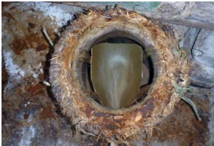
Figura 15. Detalle del trozo de penca de maguey que se coloca al interior del destilador que se utiliza como “cuchara” en donde cae el licor al condensarse los vapores de los mostos hervidos al contacto con el cazo.

agua fría. La “paleta” cuelga sobre dos tiras de fibra y está conectada, por medio de un orificio hecho en la olla, con un carrizo, por donde sale el destilado. Sobre la boca de la olla superior se coloca en cada una un cazo de cobre sobre una base de enrollado de palma con mostos (figuras 15 y 16).