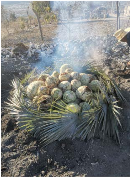
Figura 6. Colocación de las piñas del maguey en el horno.

Santa María Ixcatlán, Oaxaca.