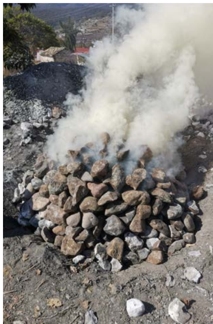
Figura 5. Encendido del fuego. Santa María Ixcatlán, Oaxaca.

Una vez encendido el horno se debe esperar aproximadamente cinco horas para que esté en su punto. Posteriormente se colocan sobre las piedras al rojo vivo pencas de maguey cimarrón y encima de ellas el maguey, porque en ocasiones el calor es tan intenso que las piñas se pueden “tatemar”; después se cubre de palmas y se coloca tierra encima. De esta manera se inicia el proceso de cocimiento del maguey, que dura unos tres días y dos noches (figuras 6, 7 y 8).