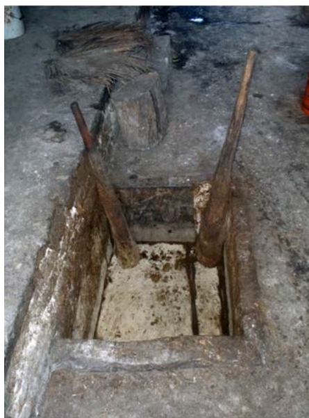
Figura 9. Mazos de madera y canoa para moler los trozos de maguey cocido. Santa María Ixcatlán, Oaxaca.

las piñas se extraen del horno y se pican en pequeños trozos para después depositarlos en un hoyo excavado en el suelo de forma rectangular llamado “canao”, el cual está recubierto de lajas de piedra caliza de la región, mientras el fondo es irregular, lo que evita que los trozos de piña se deslicen al momento de molerlos y exprimirlos “a brazo” con la ayuda de mazos de madera de encino que pueden llegar a pesar hasta 15 kilogramos (figura 9).