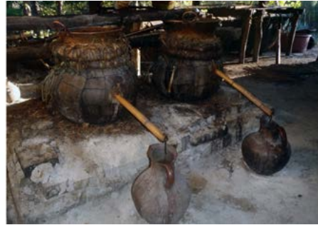
Figura 13. Ollas de barro usadas como destiladores. Santa María Ixcatlán, Oaxaca.

los pobladores le denominan “hornalla” (figuras 13 y 14).