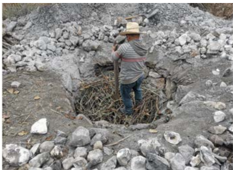
Figura 3. Colocación de las ramas secas. Santa María Ixcatlán, Oaxaca.