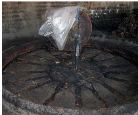
Figura 10. “Tahona” para moler los trozos de maguey cocido. Santiago Matatlán, Oaxaca. Fotografía: Víctor Hugo Romero Aranda.

de manera horizontal, ya que tiene en el centro un orificio dentro del cual corre un morillo de mezquite que se inserta en otro tronco vertical. La rueda descansa sobre un enlajado circular de piedra caliza delimitado por otras lajas colocadas verticalmente. El enlajado circular tiene dos metros de diámetro y el firme es irregular ya que también sirve para que los pedazos de maguey cocido no se deslicen al momento de ser molidos con la rueda. El morillo que está dentro del hueco del cilindro se ata a un burro que arrastra la rueda para moler los pedazos de maguey (Castellón, 2006, p. 127). Cabe señalar que este mecanismo de molienda es conocido en los Valles Centrales de Oaxaca como “tahona” (figura 10).