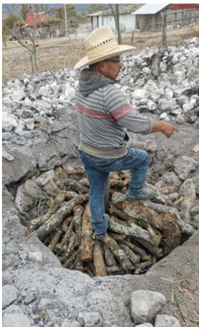
Figura 4. Colocación de las ramas secas. Santa María Ixcatlán, Oaxaca.