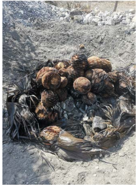
Figura 8. Piñas de maguey-potatórum cocidas. Santa María Ixcatlán, Oaxaca.

Santa María Ixcatlán, Oaxaca.