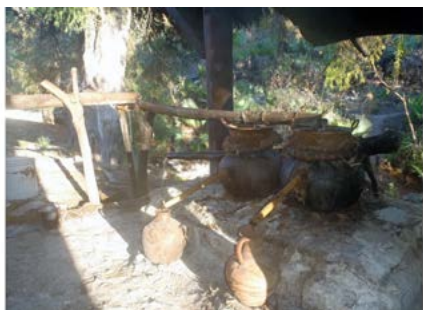
Figura 18. Canaletas sostenidas por horcones por donde corre el agua para enfriar la montera de los destiladores. Santa María Ixcatlán, Oaxaca.