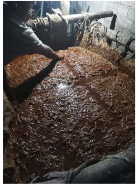
Figura 12. Artesano mezcalero revisando los jugos en su proceso de fermentación. Santa María Ixcatlán, Oaxaca.

La fermentación dura en promedio cinco días, dependiendo de ciertas condiciones, como las climatológicas, pero sobre todo de que los mostos o jugos se encuentren en su punto óptimo de fermentación, aspecto que determina el artesano mezcalero probando el tepache (figura 12).