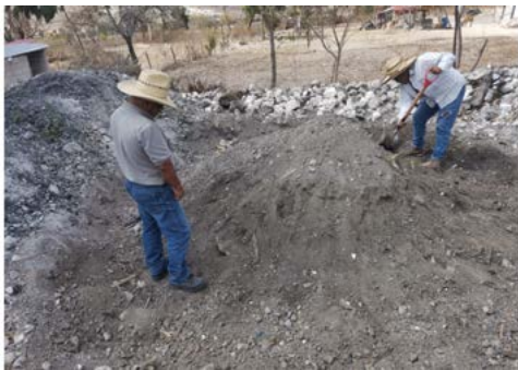
Figura 7. Cubrimiento del horno para el cocimiento u “horneado” de las piñas.

Santa María Ixcatlán, Oaxaca.