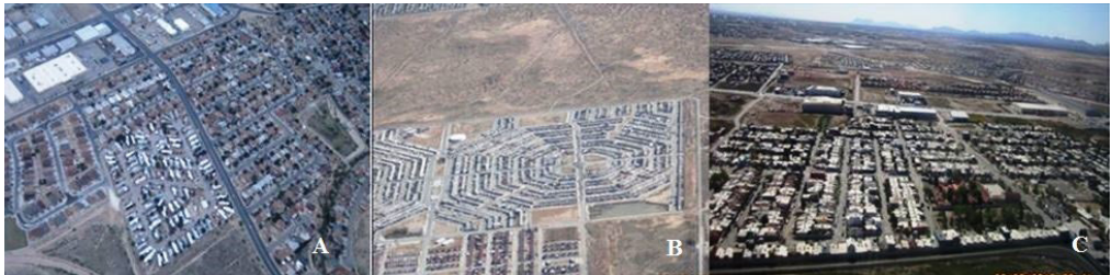
Figura 2. Áreas de crecimiento urbano en Ciudad Juárez.

En la Figura 2 se agrupan las fotografías A, B y C, las cuales corresponden a tres grandes zonas de la ciudad, donde el espacio social y territorio convergen de distinta forma. Sin duda, el lugar es parte fundamental en la vida cotidiana de los juarenses; cada asentamiento tiene sus peculiaridades en cuanto a su arquitectura, diseño, espacios de encuentro, lugares públicos y privados. Entre otros elementos, que nos ayudan a entender los procesos propios en la vida de Ciudad Juárez.