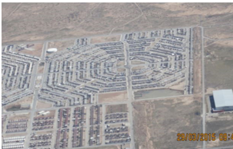
Figura 3. Medio físico en la zona sur oriente de Ciudad Juárez.

El espacio físico y social que se vislumbra como parte de ese lugar donde los usos, prácticas y mecanismos de adaptación a donde se vive son parte fundamental de estos procesos, que asumen los habitantes que a manera de ejemplo se incluye en la figura 3, la traza urbana y el medio natural les impone a sus habitantes, y en particular a aquellos que residen en esta zona de la ciudad representado por el sur oriente incluido en la zonas 3 y 4 de la figura 1 más la fotografía de la figura 3.