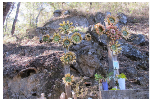
Figura 8. “El pedimento”, espacio donde los peregrinos “juegan” moldeando en miniatura los bienes solicitados a las divinidades.enero de 2017.