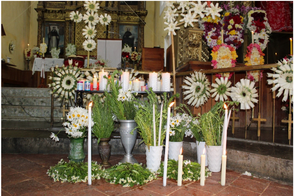
Figura 9. Ofrenda en la iglesia católica. 25 de diciembre de 2018.