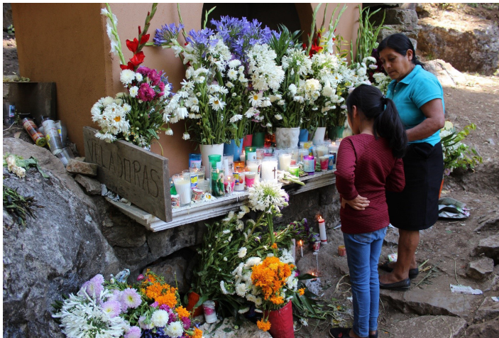
Figura 3. El espacio del ojo de agua. Bajo la capilla hay una amplia oquedad donde brota el agua.