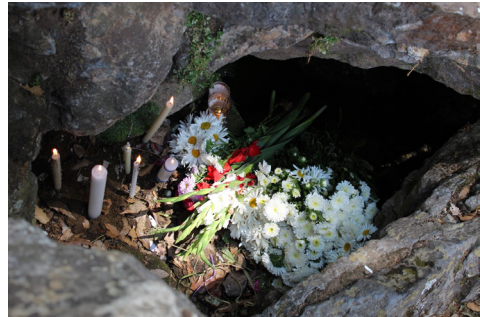
Figura 5. Ofrenda de flores y velas dispuestos en la oquedad donde brota el agua.

Fotografía: César Victoria Martínez, abril de 2019.