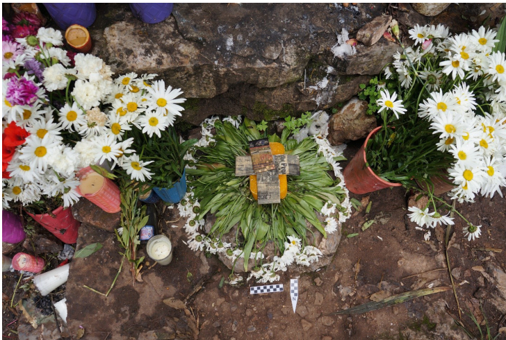
Figura 6. Ejemplo de una mes yie ‘mesa de flores’. Fotografía: Alex Elvis Badillo. Proyecto Antropológico de Quiechapa (PAQuie).

Es importante mencionar que al momento que comienza a disponer esta ofrenda el especialista ritual enuncia la frase “primeramente Dios, Madre Creador, Santísimo Rey Encantado, tres personas distintas un solo Dios verdadero...” luego continúa rezando y enunciando un constante discurso ritual en zapoteco. Al terminar de abogar por lo que se pide reza un rosario siete que es especial para pedir a la Madre Tierra y al Santísimo Cantado.