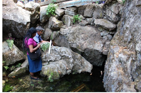
Figura 4. Petición en la base de la oquedad donde brota el agua.

Una vez que han terminado los baños rituales se dirigen frente a la oquedad donde nace el agua, al pie de las capillas, pero si hay reunidos demasiados peregrinos en ese espacio se dirigen a las rocas de donde brota el agua al exterior. En estos espacios el especialista ritual comienza a pagar u ofrendar a tres entidades sagradas principales: Dios, la Madre Tierra y el Santísimo Rey Encantado (Fig. 4 y 5). Es preciso mencionar que los elementos que se ofrendan, sus significados y la forma de disponerlos pueden variar entre especialistas, incluso de un mismo pueblo, en especial las ofrendas contadas que representan una miniatura del cosmos, 16 sin embargo, hay elementos que se comparten. Por otra parte, es preciso recalcar que en el ojo de agua de Quiechapa se hacen tanto rituales terapéuticos como rituales de pedimento para propiciar la lluvia, las buenas labranzas o la salud. Por lo tanto, esta clase de rituales presentan similitudes y diferencias en los elementos que se ofrendan y en sus procedimientos (son ofrendas contadas). Por tal razón, en este texto solo haré referencia a los rituales de petición de lluvia.