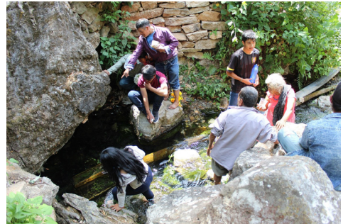
Figura 7. Los peregrinos “ven su suerte” reflejada en el agua. Fotografía: César Victoria Martínez, abril de 2019.

Una vez que han invocado y ofrendado a las deidades del ojo de agua se dirigen a la iglesia católica que se localiza en el centro del pueblo para solicitar los mismos bienes a las divinidades católicas.