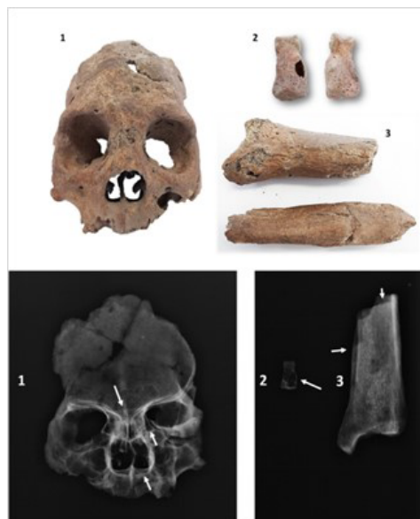
Figura 1. Vista frontal y proyección postero-anterior, con lesiones causadas por infección sistémica en región maxilo-frontal y naso-palatina (1); falange medial del quinto dedo de mano con lesión lítica en su vista dorsal y palmar (2); y engrosamiento del canal medular de tibia por lesiones no gomosas (3). En el frontal se observan además alteraciones diagenéticas que no deberían ser confundidas con caries sicca .