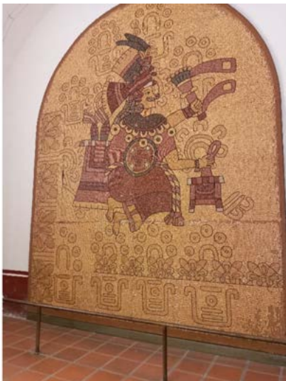
Figura 2: Representación de la diosa Xilonen expuesta en la sala del maíz.