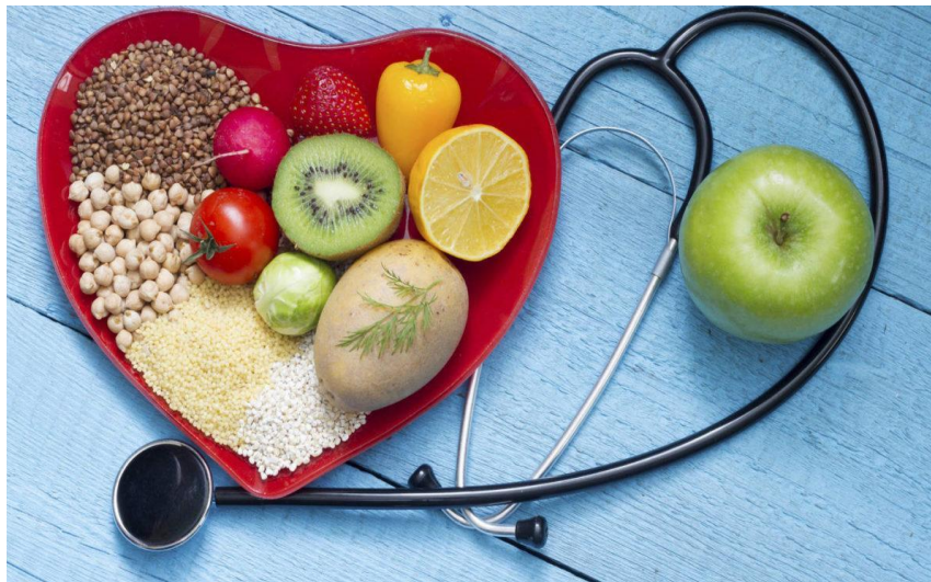
Figura 4. Uno de los beneficios de los alimentos funcionales es la salud cardiovascular.

Los alimentos funcionales y los nutraceuticos representan elementos nutricionales que son benéficos para la salud, incluyendo la prevención de enfermedades, más de lo que puede proporcionar un alimento común (Pérez, 2006). Los nutraceuticos han sido asociados a la prevención y el tratamiento de al menos cuatro enfermedades con alta tasa de mortalidad en países subdesarrollados, como las antes ya mencionadas: osteoporosis, artritis, hipertensión arterial y defectos del tubo neural, como se observa en la Tabla 1 (A, E, E, R y JI, 2009).