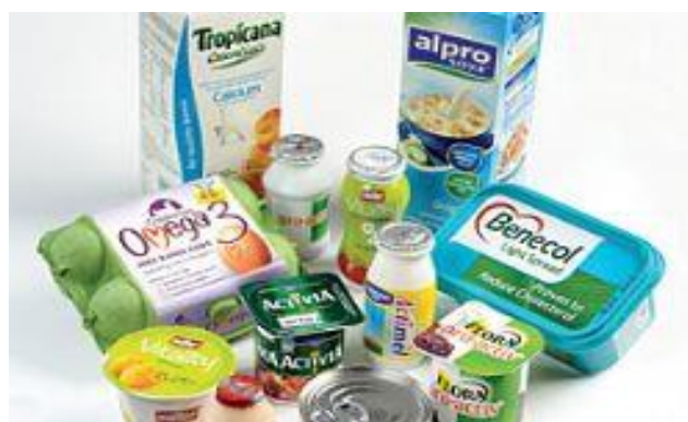
Figura 3. Alimentos funcionales modificados. Imagen tomada de Gilo, F. en carreraspopulares.com .