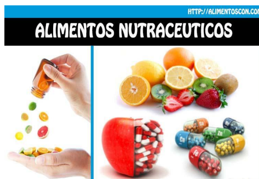
Figura 1. Nutracéuticos.

Por otro lado, la palabra nutracéutico fue acuñada en la década de los 90 en los Estados Unidos por el doctor Stephen DeFelice, Director de la Fundación de Medicina Innovadora, científico que afirma que se trata de una categoría de sustancias que se puede considerar como alimento o como parte de él y que se puede usar para proporcionar a la persona beneficios para su salud, como la prevención o el tratamiento de una enfermedad y como complemento de algunos fármacos (Pérez, 2016). Estas sustancias químicas o biológicas pueden como tal encontrarse dentro de los alimentos de forma natural o adicionarse a los mismos para otorgar al alimento esta característica y sus presentaciones varían desde cápsulas hasta polvos. Algunos de ellos, así como sus componentes, han sido aprobados por instancias gubernamentales de gran importancia como la FDA en los Estados Unidos o con el Ministerio de Salud y Bienestar Social en Japón (Valenzuela et al., 2014).