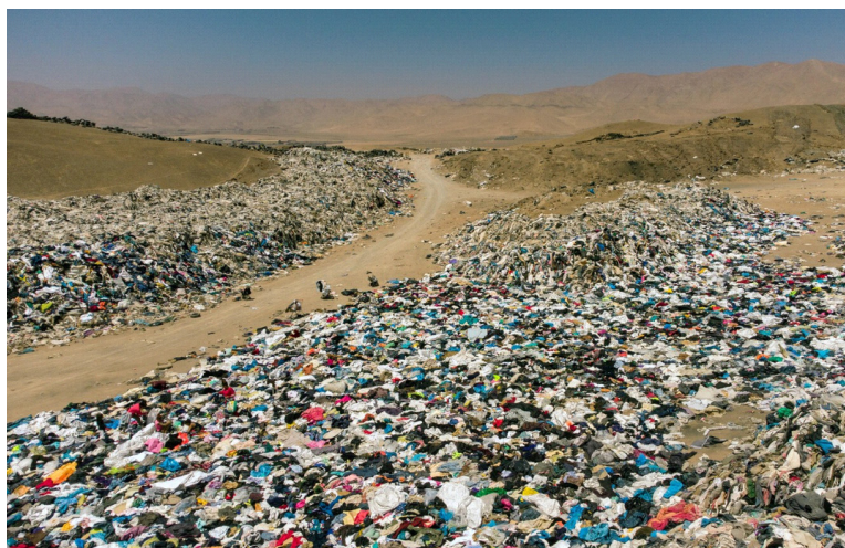
Figura 1. Desierto Atacama, Chile

No se trata de un vertedero cualquiera, sino de uno formado fundamentalmente por ropa. Se encuentra en pleno desierto de Atacama, en Chile, y en él uno puede encontrarse desde jerseys de Navidad a botas de esquí, desechos de las FF o moda rápida que están causando estragos sobre el medio ambiente. (Tena J.N. ,2021). Se estima que cada año llegan uno 59,000 toneladas al año al puerto de Iquique, al norte de Chile, de las cuales las 39,000 toneladas terminan en el vertedero mientras que la otra parte es vendida en los países latinos vecinos sin embargo es preocupante que más de la mitad de la ropa sea desechada, recordemos que las fibras con las que está fabricada la ropa de FF pueden tardar hasta 200 años en desintegrarse y esta es igual de toxica que los neumáticos que son desechados y los plásticos.