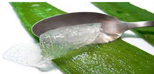
Figura 5. Gel de Aloe vera .

La preparación y estabilización de los productos de sábila suele implicar la deshidratación o la molienda; estos métodos provocan alteraciones irreversibles en varios componentes activos, así que se ha buscado plantear procesos menos destructivos (Domínguez-Fernández et al. , 2012).