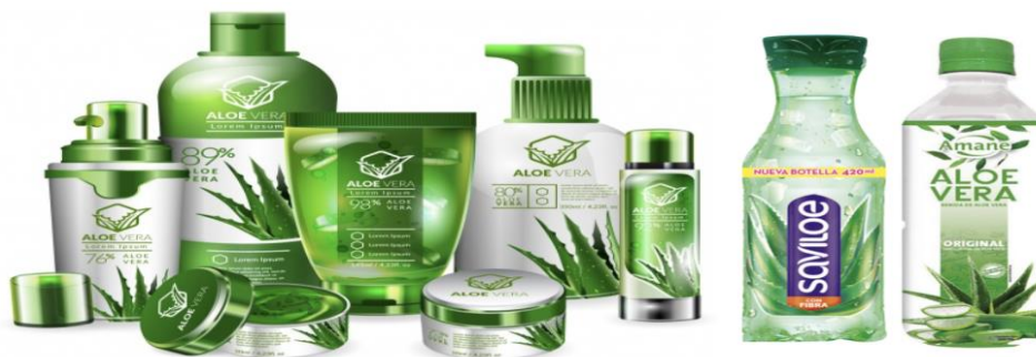
Figura 6. Productos cosméticos y alimenticios a base de Aloe vera .