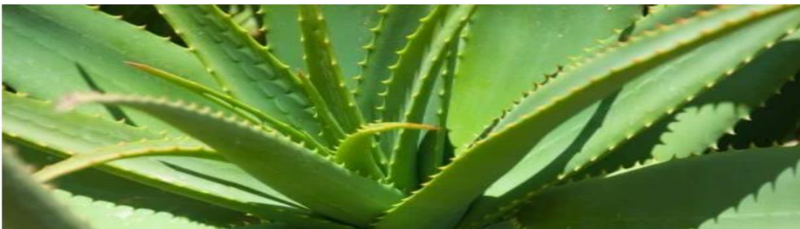
Figura 2. Planta de Aloe vera .

El Aloe vera es una planta suculenta que pertenece a la familia Liliaceae y crece comúnmente en climas tropicales. Durante siglos ha sido utilizada por muchas culturas para tratar padecimientos cutáneos, así que su eficacia se ha explorado más a fondo en los últimos 40 años. Se ha encontrado que desempeña un papel importante en la estimulación de células involucradas en la respuesta inflamatoria, el incremento en la producción de colágeno, un efecto positivo en el metabolismo de la glucosa en pacientes diabéticos (evitando complicaciones en la cicatrización), la actividad antibacteriana (en comparación con S. aureus , S. epidermis , E.coli y P.vulgaris ), y un efecto regulador en la esteroideogénesis (síntesis hormonal) (Moriyama et al. , 2016; Radha y Laxmipriya, 2015; Udgire y Pathade, 2014).