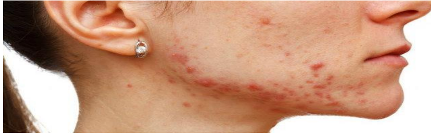
Figura 1. Acné vulgar.

Aunque hay una gran variedad de tratamientos en el mercado, debido a la importancia de obtener mejores y más rápidos resultados, se investigan más alternativas para su tratamiento, retomando conocimientos ancestrales sobre el uso de plantas medicinales (Nasri et al. , 2015). Este artículo explora el uso del Aloe vera ( Aloe barbadensis M.) para tratar las afecciones cutáneas mencionadas (Gao, Kuok, Jin y Wang, 2019).