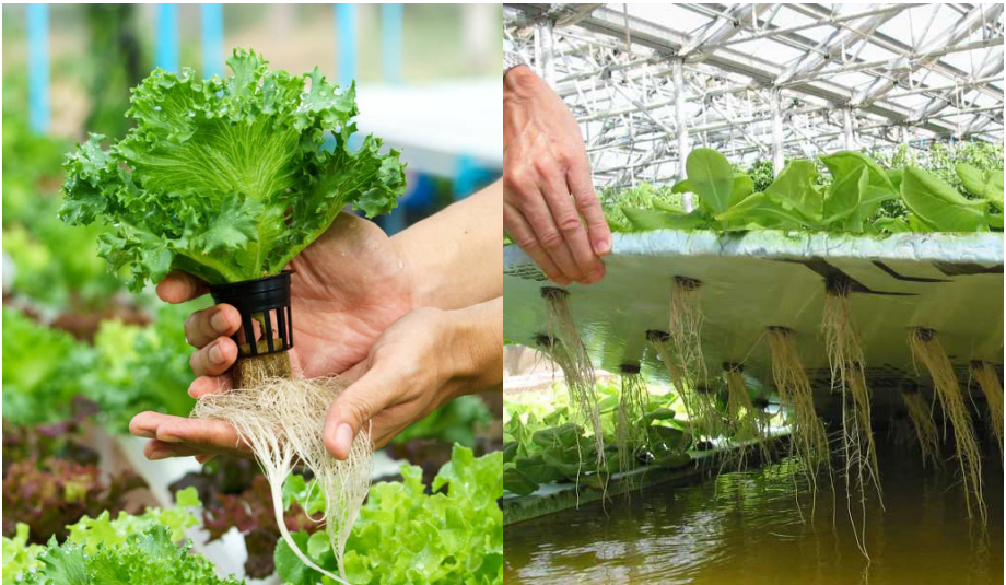
Figura 1. Cultivo hidropónico. https://r.search.yahoo.com/_ylt=AwrjZhSuw3tpk2AGfDHO8Qt.;ylu=c2VjA2ZwLWF0dHJpYGRzbG5DcnVyba-/RV=2/RE=1769747502/RO=11/RU=https%3a%2f%2fhidroponia.

Esta técnica es la base de la Agricultura vertical : los cultivos hidropónicos en forma de torres, o galeras apiladas una sobre otra para aprovechar al máximo el espacio vertical, donde antes crecían dos plantas, ahora pueden crecer veinte de tal forma que se aprovecha al máximo el espacio disponible, utilizando torres o apilando líneas de canales hidropónicos uno encima de otro dentro de grandes invernaderos en ambiente altamente controlado. En ese metro cuadrado donde antes crecían un par de plantas de acelga, ahora pueden crecer 10 o 20, o cuantas quieras en tanto alto quieras ir.