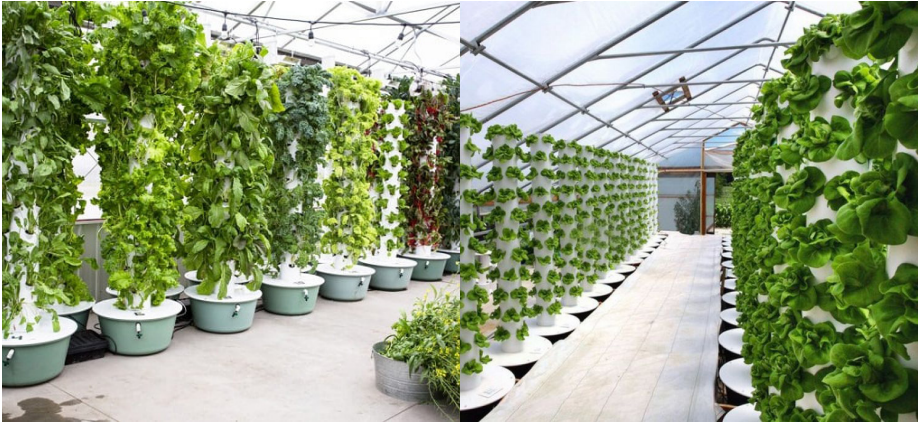
Figura 2. Torres hidropónicas. https://r.search.yahoo.com/_ylt=AwrOo13FyXtpVAoQX.z08Qt.;yлу=c2VjA2ZwLWF0dH-JpYgRzbGsDcnVyBA--/RV=2/RE=1769749061/RO=11/RU=https%3a%2f%2fwww.arkiplus.com%2fhidroponia-vertical/RK=2/RS=Cbehf7K62ieCcpMXrjDa34LAsU-