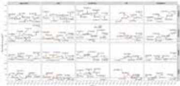
Figura 4: Tendencias de emisiones de PM 10 en Puebla, México, de los años 2015-2024. Datos crudos promediados por estación a lo largo de 9 años para 5 estaciones de monitoreo ambiental. Elaboración propia en R/RStudio.