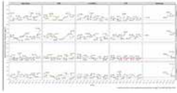
Figura 3: Tendencias de emisiones de PM 2.5 en Puebla, México, de los años 2015-2024. Datos crudos promediados por estación a lo largo de 9 años para 5 estaciones de monitoreo ambiental. Elaboración propia en R/RStudio.