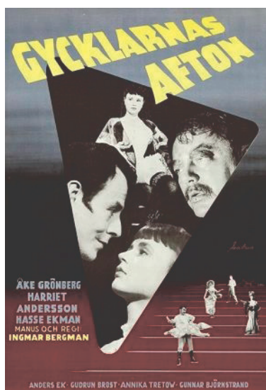
Imagen 1. Fotograma de la película Noche de circo (1953).