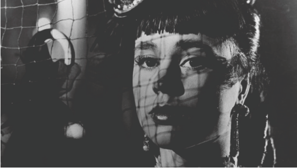
Imagen 2. Fotograma de la película Noche de circo (1953).