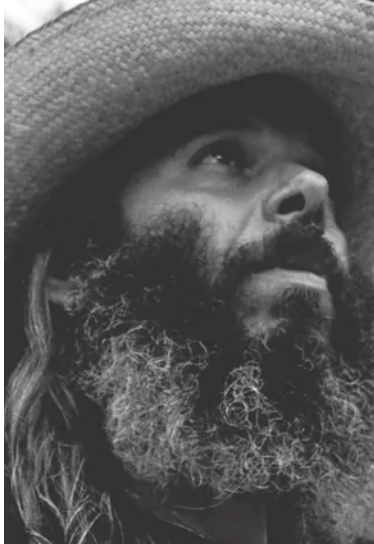
Imagen 1. Fotograma de la película Pájaros de verano (2018).