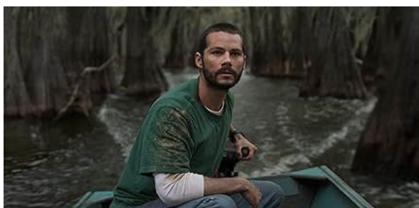
Imagen 1. Fotograma de la película

Me gustaría hacer énfasis en la frase con la que Paris marca el cierre de todas sus posibilidades: “No, no, no, solo quiero volver con mi familia, yo... quiero ir a casa”. Es así como su historia se ve interrumpida prematuramente. Vemos cómo su muerte, más que una tragedia, es una de las consecuencias de una posibilidad que no pudo ser realizada y de un tiempo no habitado.