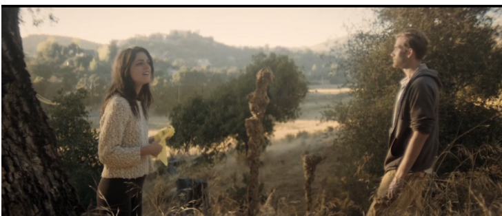
Imagen 1. Fotograma de la película

Los bucles temporales representan limitaciones en la cognición y existencia de los personajes, los personajes no pueden ver más allá de lo que el bucle les muestra, estos bucles son una representación de la perspectiva de la realidad que cada personaje mantiene. Es decir, todos los personajes están cegados a la información externa al bucle que habitan. Su mundo es el bucle temporal.