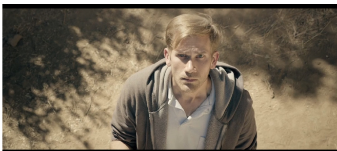
Imagen 6 y 7. Fotogramas de la película.

La primera forma en que se presenta este fenómeno es a través de las interacciones de la entidad y los protagonistas. Esta entidad se comunica con los personajes con ayuda de medio audiovisuales, en concreto, fotografías y cintas de video. Para nosotros como espectadores estas interacciones aparecen de una manera distinta al modo en que aparece para los personajes, nosotros poseemos una perspectiva ajena a la de todo personaje de la cinta, tenemos la vista de la cámara. En ciertos momentos compartimos perspectiva con los personajes, pero hay encuadres concretos que no pueden ser compartidos con los personajes.