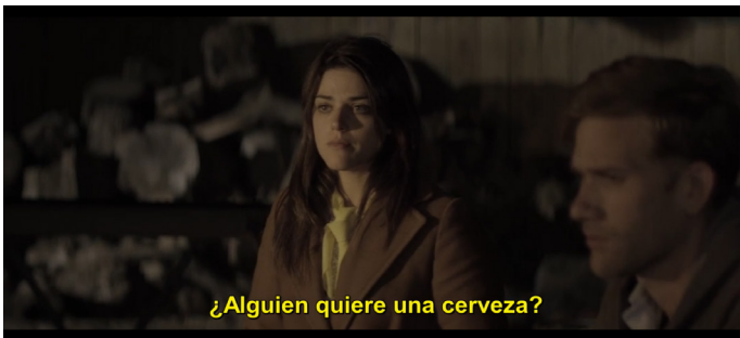
Imagen 3. Fotograma de la película

del alcohol, desde que los hermanos arriban al campamento, lo único que beben es cerveza. Resulta interesante considerar el protagonismo que la cerveza tiene en la comunidad, el personaje Tim, quien la produce, en algunos momentos bebe cerveza y la tira sin razón, molesto por algo. Además, intentan explicar esto estableciendo la idea de que Tim está en busca de la cerveza perfecta, se ha dedicado a producir cerveza todos estos años para obtener la de mejor calidad. Pero esto no se expresa en la secuencia donde la bebe y la tira, más bien, parece manifestar un tedio hacia la bebida, posterior a su consumo. Una relación de dependencia y odio.