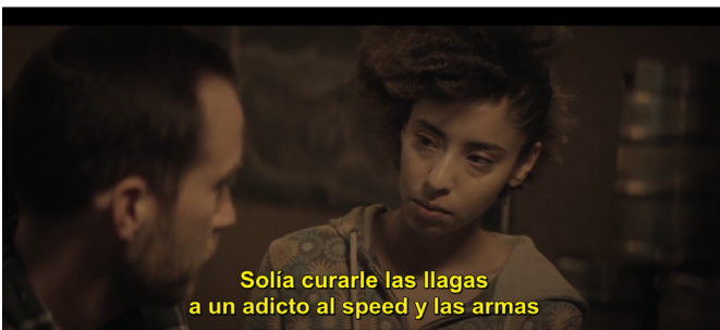
Imagen 4 Y 5. Fotogramas de la película

Otro diálogo de Lizzy es revelador, en este caso directo con Justin cuando le cura una herida de las manos, en donde declara que ella fue adicta a alucinógenos y antipsicóticos. Y, en este mismo diálogo (Ilustración 3) establece una interesante relación con otro personaje que habita en su propio bucle de 3 horas. Remarco el tiempo de este bucle, porque al parecer la caducidad de los bucles corresponde con el tipo de objeto de adicción. En esta secuencia Lizzy, además de admitir que es adicta a estas sustancias, expresa que aprendió a hacer vendajes cuando frecuentaba a un adicto de las armas y el speed. Este personaje es Shitty Carl (Ilustración 4), quien se caracteriza por manifestar un comportamiento muy agitado, paranoico, delirante, y con cambios de humor extremos.