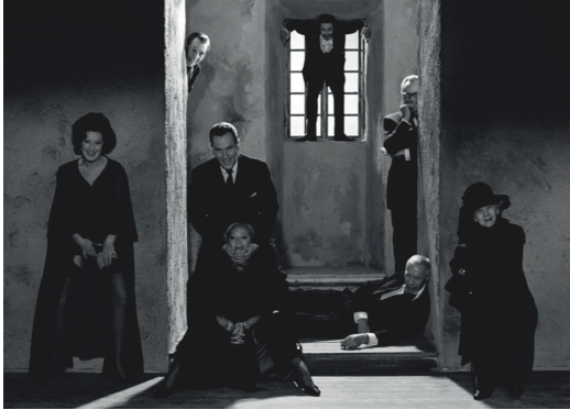
Imagen 1. Fotograma de la película.