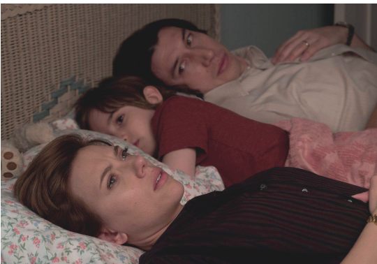
Imagen 1. Fotograma de la película.

El film concluye con Nicole cediendo su día para que Henry pase el día con su padre, afirmando su personalidad, Nicole le ata las cintas de los zapatos de Charlie que se encuentran desatadas, mostrando las viejas costumbres de su relación, poco a poco se aleja la imagen, dejándonos el plano de una calle. La fotografía de Robby Ryan al igual que el montaje de Jennifer Lame son una parte esencial dentro de la obra, ya que logran mostrarnos y ubicarnos dentro de la trama por medio de planos estáticos y cautivadores.