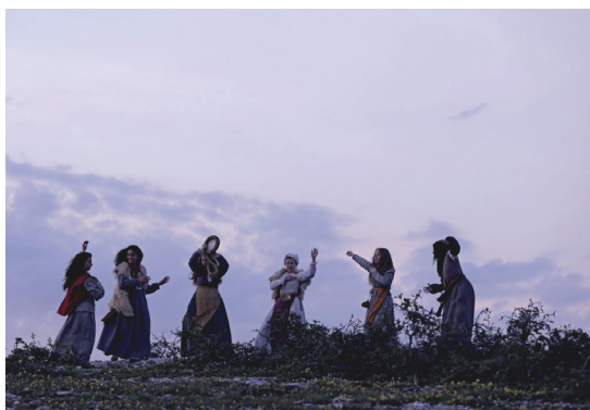
Imagen 1. Fotograma de la película.