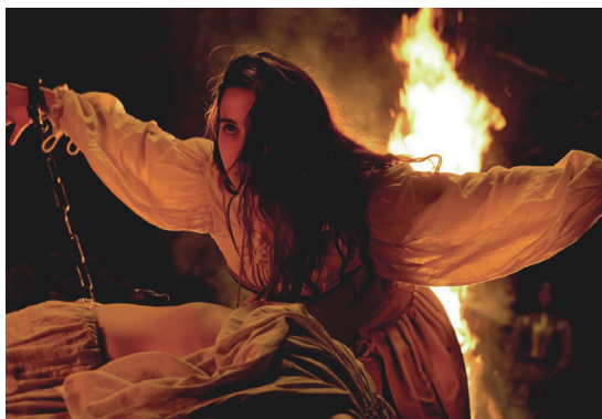
Imagen 2. Fotograma de la película.

las mujeres, como acto performativo, fue tomada como una de las actividades más reprimidas y sancionadas, dado que en los movimientos frenéticos se cuele el apetito de la carne. Idea que encaja con el dispositivo ideológico del pecado cristiano. Quien desea pecar, pero la otra parte también comete una falta porque provoca, sea a través de la acción o de la imaginación. Dentro de este marco, es importante entender que la dominación y la resistencia plasmadas en Akelarre se dan a través de las esferas emocionales, inconscientes y discursivas, mediante relaciones de poder vinculadas a contextos sociohistóricos que regulan estas prácticas. Desde este punto de vista, el cuerpo y la psique son considerados espacios de poder.