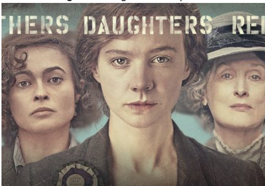
Imagen 1. Fotograma de la película.

Esto me hizo reflexionar, por una parte, que ante muchas situaciones, movimientos y luchas nos encontramos así, ignorantes, inconscientes, como “de espaldas al mundo”, “dormidos”, habiendo perdido la posibilidad de percibir claramente la situación por la que estamos pasando y por ende de hacer algo –tanto individual como colectivamente–. Ese “estar de espaldas” no sólo con el mundo, sino frente a nuestra propia situación hace preguntarme: ¿qué hace que no reconozcamos que cierta relación con algo, cierta manera de vivirse algo, de pensarse algo, esté bien o en su defecto mal? ¿Qué permite que de un momento a otro algo que se considere totalmente “normal” o “bueno”, un buen modo de vida que parecía razonable tener, ya no lo sea? ¿Qué hace que se piense de otra manera una situación, un problema, un discurso? Pero, por otro lado, también me hace reflexionar que “tarde o temprano” ese “estar de espaldas” ameritará una vuelta: un “estar de frente” ante la situación. Tal como la misma película nos lo ilustra cuando Maud Watts comienza a interesarse por el movimiento y ella misma se dice: “cuan dormida estaba, ahora estoy despierta”, lo cual podemos traducir en ser consciente de sí, de su situación, de lo que está pasando a su alrededor y el coraje y necesidad que se requieren para enfrentar aquello en lo que se está –ahora– en desacuerdo.