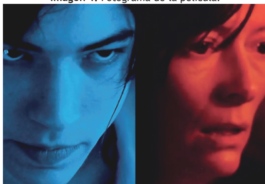
Imagen 1. Fotograma de la película.

vez le devuelve otro desafío a la madre. La serie de pequeños intercambios es inagotable, pero hay efectos no pequeños que trastocarán la vida de la comunidad. Bird, el personaje principal de Una cuestión personal de Kenzaburo Oé, siente ante la inminente llegada de su hijo que se le cierran puertas, que varias posibilidades de acción no seguirán latentes después del nacimiento. Allí el hijo tiene un problema cerebral y la posible condición vegetativa atormenta al padre, le molesta la idea de quedar prisionero y empieza a esbozar acabar con la criatura. Eva, después de soportar varias agresiones, en un arranque de ira y franqueza le dice a su bebé que ella estaría mejor en otro lado, viajando, sin él. Ya está en una prisión, la relación materna se vuelve complicada cuando algo del hijo (¿endosado por la madre?) encierra. Hay en esa cárcel un juego de fuerzas que se confunde con muestras de cariño, los regalos no son caricias, las atenciones no pasan con suavidad.