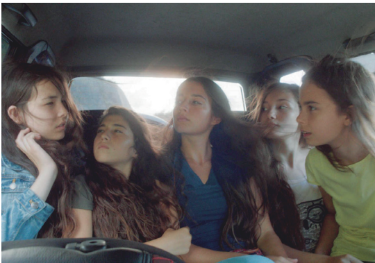
Imagen 1. Fotograma de la película.

sin violencia física. En este caso –continuando con la semejanza de dominación que se ejerce sobre las mujeres en el filme y el amaestramiento de caballos–, la doma se llama doma india, pues esta técnica –en teoría– busca respetar al animal y su principio consiste en obtener la confianza del caballo a partir de caricias, cariño y alimento. A este tipo de doma se le denomina así por la manera en la que los indios trataban a los caballos, a diferencia de los europeos, mostrando que existen diferentes maneras de relacionarse con la naturaleza. Lamentablemente, la sociedad no pensaría lo mismo cuando se tratase de mujeres. Volviendo una vez más a la cinta, se recordará que el confinamiento de las jóvenes es inclemente pero seguro, a primera instancia, con alimentos, ropa y refugio necesarios. No hay ningún tipo de violencia “física”, algo que sin duda alguna aparecerá prontamente, especialmente cuando se muestra que dos de las hermanas eran abusadas por un miembro de la familia, a tal grado que una de ellas se suicidó.