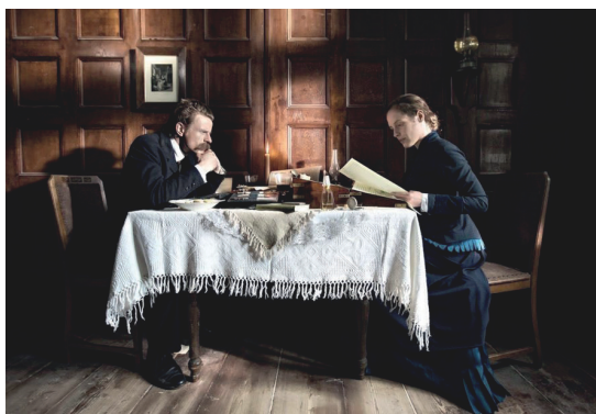
Imagen 1. Fotograma de la película.