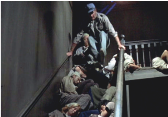
Imagen 1. Fotograma de la película.