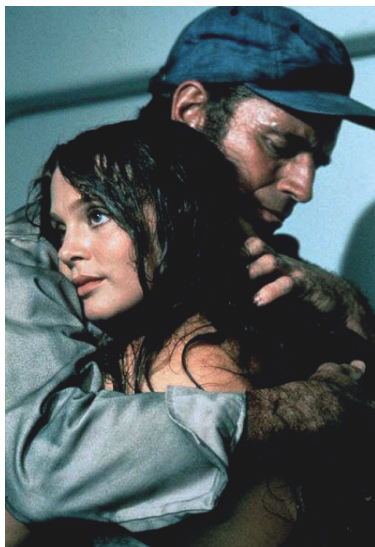
Imagen 1. Fotograma de la película.