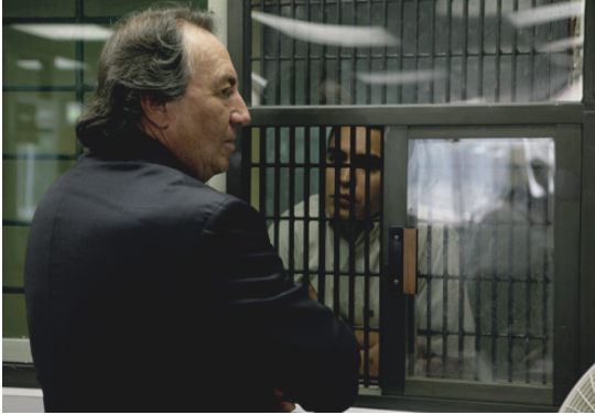
Imagen 1. Fotograma de la película.

tantos casos y consistentemente no se respeta su autoridad/capacidad sino la de alguien “más importante”. Un sistema que no sigue el debido proceso. Un sistema cuyos centros de readaptación o reinserción social son una vergüenza nacional a la que nos hemos acostumbrado. Un sistema que ha hecho, paradójicamente, de los procuradores de justicia trabajadores en pro de la ilegalidad.