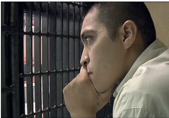
Imagen 1. Fotograma de la película.

nos platican cómo han participado de la barbarie nacional y el espectador piensa, como lo piensa en Presunto Culpable , “eso me puede pasar a mí”. Esa fácil identificación con los protagonistas de ambas películas nos lleva rápidamente al terreno del miedo. La violencia está clavada de varias maneras en nuestras relaciones sociales diarias, pero hay ciertos tipos de violencia que están generando, desde hace años, un rastro de sangre incommensurable. Principalmente aparece en la disputa de plazas entre los cárteles del narcotráfico, pero la delincuencia organizada también controla otros negocios: la explotación sexual de mujeres, el tráfico de migrantes, la pornografía y prostitución infantil, el robo de combustible, la tala ilegal, la piratería, los secuestros, las extorsiones a comerciantes (derecho de piso), el robo de autopartes y otros tantos. Todo lo anterior genera muchas muertes, desapariciones y tristeza.