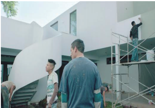
Imagen 1. Fotograma de la película.

birá indemnización alguna por parte del dueño de la casa. El grupo de albañiles buscará justicia no solamente por la nula compensación, sino también por una vida llena de carencias, contrastes y opresión” (FILMAFFINITY, 2019). En este sentido la película cumple bien con el reflejo de desigualdad y corrupción humana. El director hace énfasis en la peculiaridad que contrasta entre la vida ordinaria del empleado y sus viviendas, con el estilo de vida del patrón o contratante de obreros.