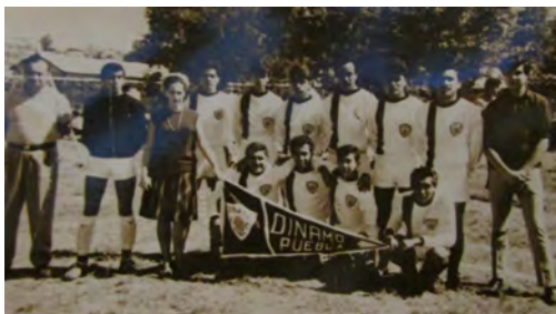
Imagen 5. Madrina del equipo de futbol Dinamo Puebla (s/f).

Sin duda, una de las marcas territoriales de la memoria de El Mayorazgo se materializa a través del parque deportivo. Hasta la actualidad, es un soporte lleno de ambigüedades pues es una mixtura de prácticas políticas, religiosas, deportivas, sociales y económicas, que fluctúan y se acompañan entre lo conflictivo y lo armonioso, entre disputas y luchas por el espacio: