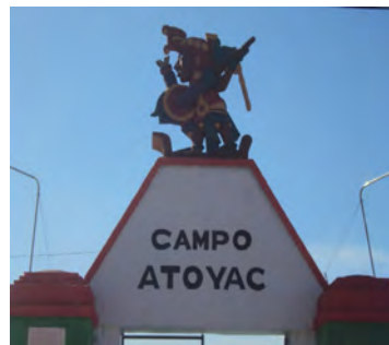
Imagen 6. Fachada exterior del Parque deportivo Atoyac en el que se observa al parecer, un personaje mixteco.

Algunos informantes consideran esta representación como afirmación y fuerte relación con el río Atoyac, y que durante mucho tiempo fue parte de la imagen corporativa de la fábrica.