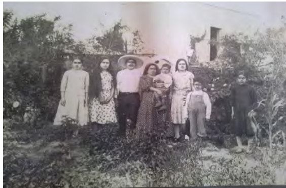
Imagen 1. Familia de El Mayorazgo (ca. 1920).

La vida obrera transcurría en tres turnos, de 7 am. a 3 pm., de 3 pm. a 11 pm. y de 11 pm. a 7 am. Cuando incrementaba la producción, los turnos fueron cuatro. Este horario también se emplazaba a la cotidianidad fuera de la fábrica, se encarnó en otros actores, se naturalizó en el territorio y el paisaje sonoro de El Mayorazgo. Cabe señalar, que a pesar de la avasalladora industrialización que permeó en muchos rincones del país, las formas de vivir se convirtieron en una mixtura de escenarios que incorporaron el modelo productivo y modernizador. Esta forma de organización fabril buscaba congregar en un caserío y con todos sus servicios, a sus trabajadores para garantizar le eficiencia productiva, y por parte de sus vecindados, se observa un fuerte arraigo a las prácticas socio-culturales provenientes de un contexto rural, pues el primer oficio de los obreros fue campesino. Algunos informantes refieren que Mayorazgo “era como un pueblo” (Imagen 1).