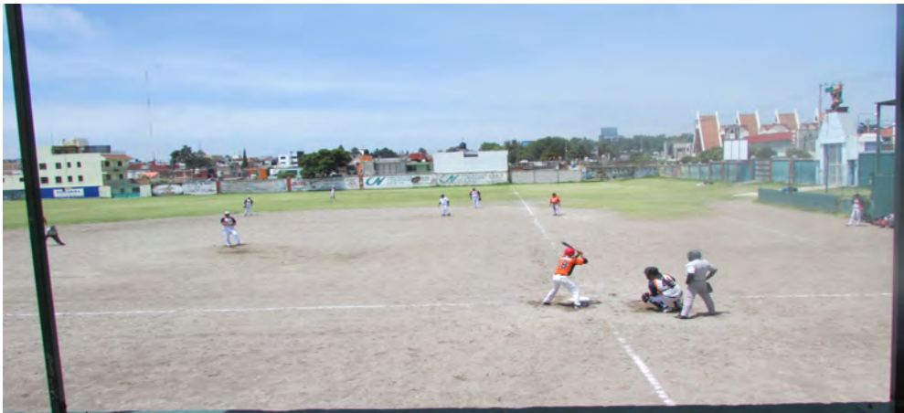
Imagen 9. Partido de béisbol de equipos foráneos.

recorridas, las bases robadas, se dibujaron nuevamente las siluetas de los cuerpos en sintonía con la tensión de una carrera, se oyen nuevamente los rechifles, las chelas futboleras después de entrenar, el olor a cemitas, los silbatos, la botana de un fin de semana y la concurrencia de las familias que continúan estas prácticas deportivas que se transmiten a otras generaciones, no con la misma mirada del pasado, pero sí con un presente permeado por las circunstancias actuales que orientan nuevas, complejas y contradictorias formas de habitar con la memoria el territorio de El Mayorazgo.