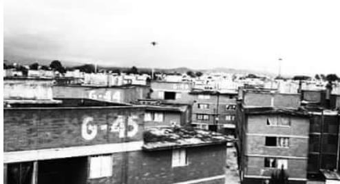
Ilustración 2. Mi paisaje (Informantes San Bartolo y Lomas de Angelópolis, 2015).

De esta manera, Occidente atribuyó a la vista un espacio privilegiado ante la subordinación del resto a disposición de lo que puede o no ser observado. Siguiendo la crítica de este autor, el ocularcentrismo arquitectónico ha contrarrestado la experiencia sensorial de los espacios vitales reduciendo la aprehensión