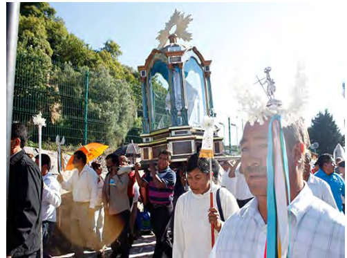
Ilustración 2. Colectivo Cholula Viva y Digna, Septiembre 2015. La procesión de la imagen peregrina de la virgen de los Remedios, que recorre el territorio para protegerle de las intenciones de dignificación de los gobiernos estatal y municipal.

[...] la Virgen viene a sustituir a Chiconauhquiuhuitl o “nueve lluvias”, sobre el Tlachihualtepetl, es decir, a un dios que representa el agua y cuya pirámide, según la tradición, se asienta sobre un pozo de agua. Todo esto nos confirma la asociación Mariana con el agua y una posible explicación de porqué fue colocada sobre la pirámide (Olivera, 1970: 71).