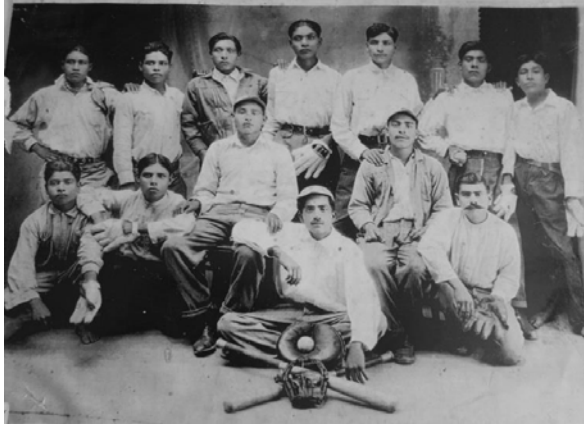
Imagen 2. Uno de los equipos de béisbol más antiguos (1920 ca.)