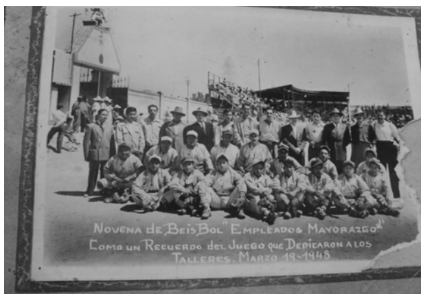
Imagen 3. Parque deportivo Atoyac textil (1948).

Así, la red de relaciones no se limitaba a un único centro fabril, sino se extendía hacia otras industrias con las que se estrechaban lazos, se creaban compadrazgos y relaciones competitivas para la convivencia dentro del mismo gremio. Estas prácticas por lo regular no eran aisladas, sino conformaban un conjunto de actividades que se desarrollaban con motivo de alguna festividad o celebración religiosa, por tanto, se convertían en sistemas