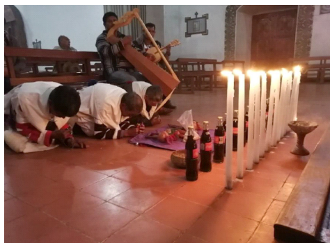
Figura 2. Rezo de los especialistas en la iglesia de Santo Tomás.

más, al mismo tiempo que los músicos hacen su faena. Esto dura veinte minutos, aproximadamente. Después, se ofrenda el refresco de cola a todos los participantes. Al mismo tiempo, los especialistas rituales chocan sus crucifijos y cada persona debe besar estos objetos. Por su parte, los cueteros hacen su trabajo, prendiendo cuestas cada cierto tiempo. Concluido esto, se dejan las velas que se deben consumir. Se parte de regreso a la casa donde comenzó el ritual. Ahí se hace otro rezo con música y cuetes. Aquí los mismos especialistas repiten los movimientos anteriormente expresados.