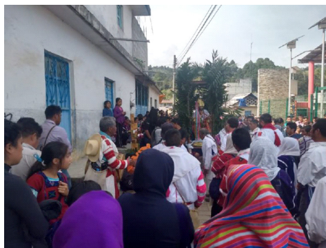
Figura 1. Rezador haciendo plegarias en una las cruces como parada de Santo Tomás.

a forma de casa. Seguido de ellos está el rezador principal vestido en el traje oxchuquero, para terminar con una banda de viento y un comité de jóvenes, desde la reina de Oxchuc, hasta más mancebos vestidos con máscaras, como si fuera un carnaval. Todos estos en la parte central. Las demás personas se ubican a los costados del grupo (figura 1).