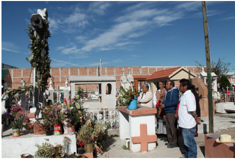
Figura 4. Socios del barrio de San Isidro en ritual llamado enrosamiento* en el panteón, 2016.

La fe se demuestra a través del trabajo, otro valor importante para los socios. El trabajo se traduce en las funciones y actividades que cada uno debe desempeñar por el grupo y el grado que posee. Esto se puede ver en las actividades que realizan los socios a lo largo del año. A pesar de que la asistencia a las juntas mensuales a veces es incompleta, durante los eventos grandes la participación es fuerte. Los primeros capitanes insisten continuamente en que los socios deben dar testimonio de su fe a través de su trabajo. Otros también lo conciben de ese modo al asegurar que el compromiso de ser socio debe pensarse, pues las responsabilidades deben cumplirse. El trabajo bien hecho se atribuye a la gracia del santo, pero también al esfuerzo del socio y de todo el grupo.