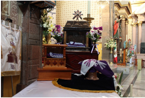
Figura 1. Imagen peregrina, imagen chiquita y reliquias del Santo Entierro de Cristo.