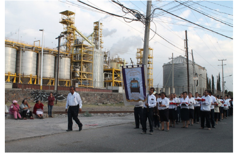
Figura 6. Procesión del Barrio del Espíritu Santo para ritual llamado enrosamiento, 2017.

mucha gente, donde haya poca gente, lo vean pasar y digan ‘como quisiera ser socia del Santo Entierro’; que en ese conocimiento digan ‘existe Dios, ahí está Dios, ahí va Dios’.