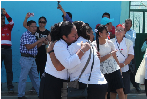
Figura 3. Abrazo entre comadres, ambas primeras capitanas de sus respectivos barrios, 2017.

dres por el Santo Entierro, el título se adquiere de manera vitalicia, aunque al siguiente ciclo (seis años después) tengan nuevos compadres. De esta manera el parentesco ritual se va acrecentando.