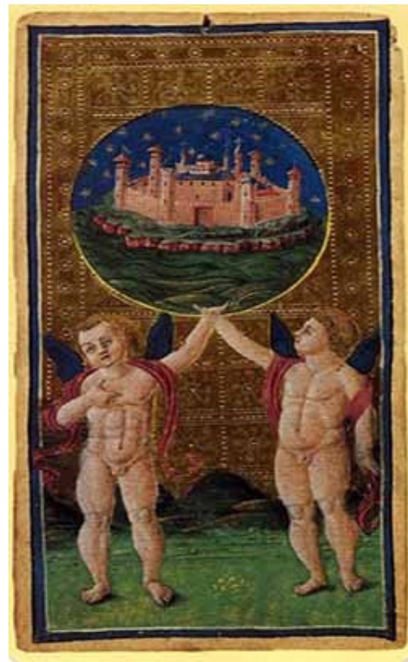
Fuente: Tarot Visconti Sforza.