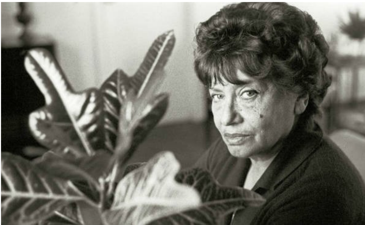
Figura 1. Olga Orozco (1920-1999).