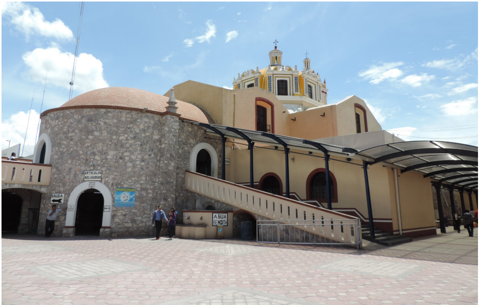
Imagen 4. Santuario del Niño Doctor.