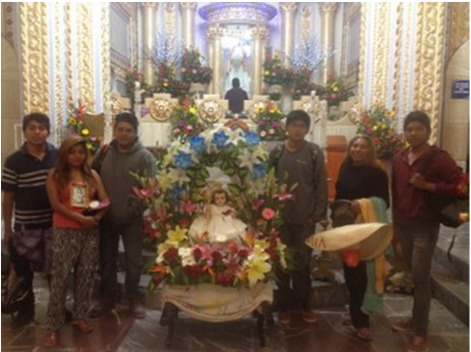
Imagen 2. Anda del Niño de Huehuetlán "el molerito".