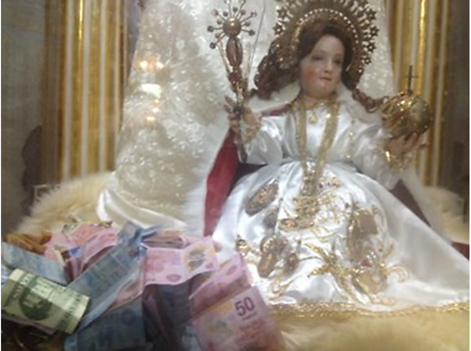
Imagen 1. Escuelas epistemológicas.