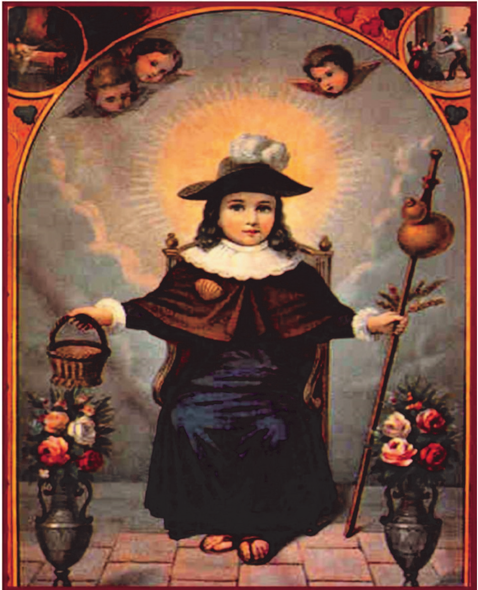
Imagen 7. Imagen del Santo Niño de Atocha.