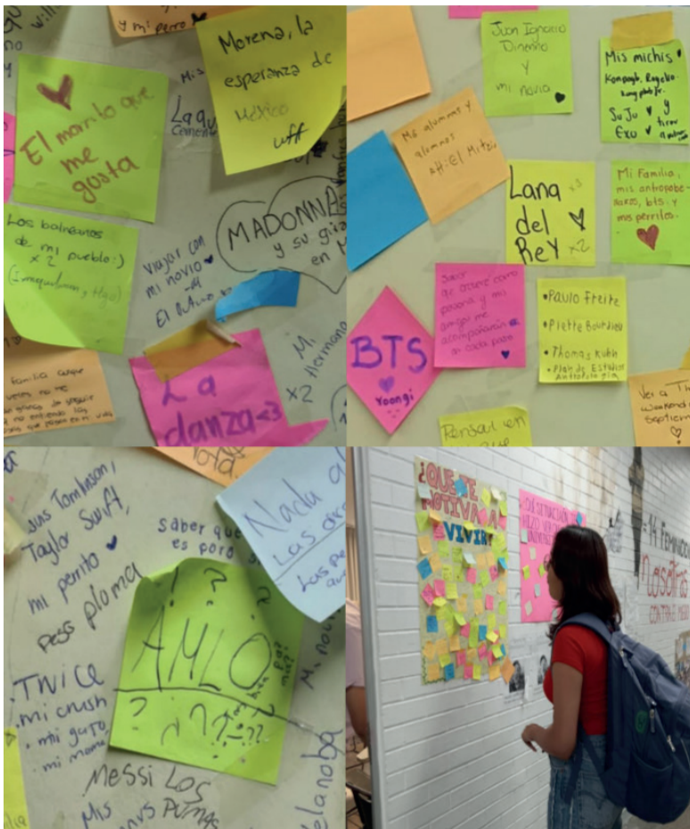
Figura 2. Enriquez Transformando espacios.

de leer, y responder a sus compañeros (ver Figura 2 ). Aunque lo anterior tampoco significó que la realización de toda esta actividad se hubiese hecho en completa armonía, ya que existieron diversos conflictos gráficos entre dicho conglomerado, esto no solo en el sentido de que mientras algunas motivaciones solían recibir respuestas positivas, otras eran censuradas al ser rayoneadas, despegadas o cubiertas por otras motivaciones con mayor relevancia representativa para el estudiante promedio (ver Figura 2 ); si no también por el hecho de que mientras algunos de nosotros tenemos algo por lo que vivir, existen otros que lo han perdido todo hasta el grado de empezar a tener pensamientos suicidas.