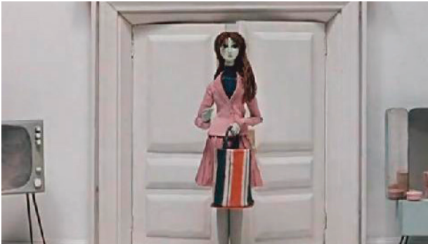
Imagen 1. Escena de la película.