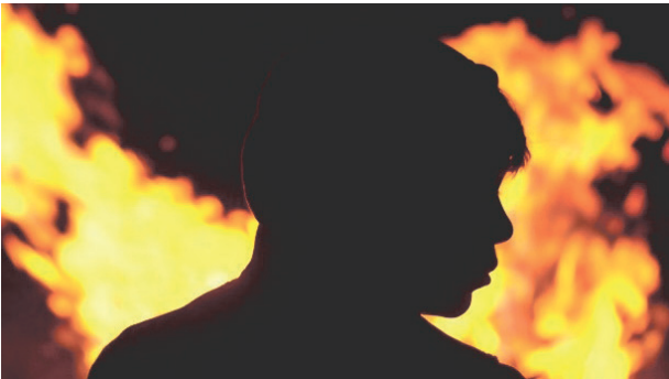
Imagen 1. Fotograma de la película Sin señas particulares (2020).