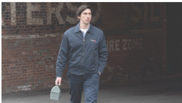
Imagen 1. Fotograma de la película.

En sentido espacial, el personaje interpretado por Adam Driver es en realidad un lugar: Paterson, New Jersey, cuna del escritor Allen Ginsberg, del comediante Lou Costello y del poeta William Carlos Williams. En Paterson el paso tiempo ha sido sitiado, y mediante espaciamientos cortos y controlados, domesticado: sale el sol, el hombre-ciudad despierta, besa a su mujer en la espalda y comienza a corroborar que el mundo sigue allí, intacto, tal como lo dejó la noche anterior. It's nice out, Warm, Sun on cold snow, First day of spring, Or last day of Winter... da igual. Para los que enraízan profundo, como Paterson en Paterson, el tiempo fluye de manera circular, se anula. Sin embargo, todo orden es arbitrario y puede colapsar en cualquier momento. Por más sólidos y uniformes que sean los espaciamientos, una vida edificada sobre la seguridad del espacio tiene fisuras por las que se filtra la nostalgia y la incertidumbre. Quizá por ello nadie se atreve a construir para la eternidad. Algunos juran y prometen tímidamente, otros apenas oponen resistencia al fluir universal de la materia.