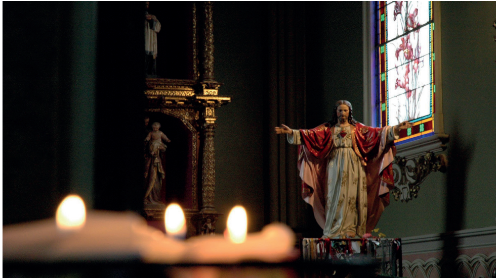
Imagen 1. Fotograma de la película.