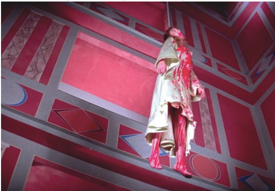
Imagen 1. Fotograma de la película.

procede de una bruja, quien es portadora de un gran poder. A diferencia de otras películas en torno a brujas, en las que el poder absoluto es ostentado por una figura masculina como la del diablo; o en la que los problemas giran en torno a éste, ya sea por maltrato, misoginia, etc., en Suspiria se rompe dicho paradigma, porque los problemas son causados por mujeres y resueltos por éstas. Las brujas actualmente pueden ser tomadas como un símbolo de liberación femenina por ser supervivientes en un mundo hostil. En todas las épocas las mujeres han sido criminalizadas, perseguidas, estigmatizadas y asesinadas por razones de género como fondo, aún en aquellas en las que no había ni feminismo ni teorías de género para analizar esta situación como tal. Las brujas no eran más que mujeres con amplios conocimientos de astronomía, matemáticas, medicina, filosofía, espiritualidad; y precisamente por ello alteraban el orden social impuesto por intereses políticos, religiosos y económicos. La difundida idea de que tenían contacto con el diablo y a él servían; que deseaban acabar con la vida, atentando contra el orden y la paz del mundo, fue la mejor excusa para dar pie a su caza y su asesinato. Actualmente la bruja se utiliza como figura feminista de resistencia social en las luchas y movimientos políticos, y más específicamente en las luchas feministas.