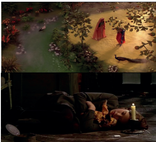
Imagen 1. Fotograma de la película.

ne todo. En realidad, al ser Sara criada en “el país de la magia”, de forma libre, con mucho amor, donde su padre y sus nanas le rodean de historias fantásticas sobre el mundo, no entiende muchas de las obligaciones que existen en el colegio, y como espíritu inocente, cuestiona a voz viva algunas de estas extrañas reglas. Vemos, por ejemplo, una escena donde crea una historia alternativa de una novela que estudiaban en una noche de lectura de clásicos porque le parecía aburrida e injusta, así, ella se atreve a imaginar y contar su historia con otra trama más aventurera y emocionante. La situación entre la institutriz y la niña merece especial atención si la confrontamos con la idea de las tres personas interiores en la mente humana planteada por el psiquiatra chileno Claudio Naranjo. Estas tres personas interiores que cada individuo tiene “dentro de sí”, son lo que llama “el padre, la madre y el niño”. Son títulos que corresponderían, si se usara un lenguaje más académico, a lo intelectual, lo emocional y lo instintivo, respectivamente. En el lado del padre está el intelecto, la normatividad, la crítica, la ciencia y la sociedad moderna civilizada. En la madre encontramos el aspecto emocional, la relación con el prójimo, la compasión y la empatía, así como el amor incondicional. Por último, en el niño, aparece el instinto, la bestialidad que busca expresarse por el placer del cuerpo (deseos, lujuria, pasiones) así como por medio de la espontaneidad y la creatividad.