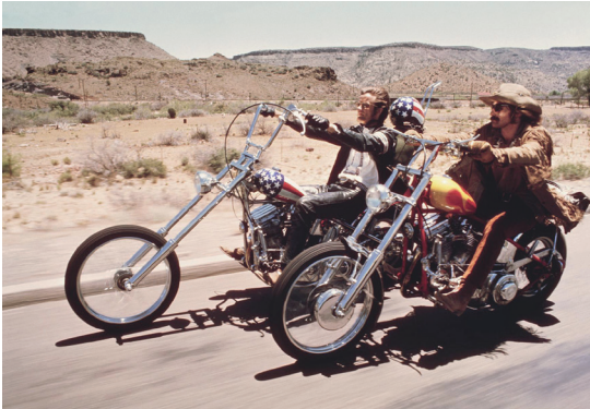
Imagen 1. Fotograma de la película.