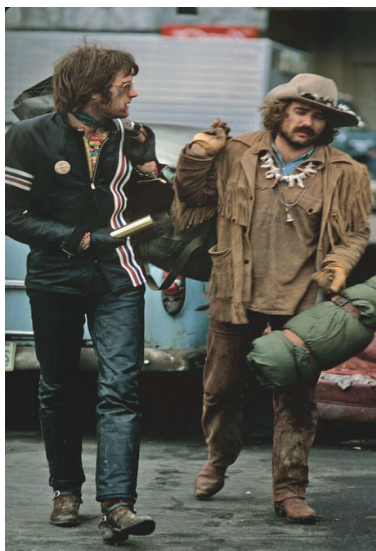
Imagen 1. Fotograma de la película.

solidaridad de forastero, comunidad con la naturaleza, pacifismo y disposición al juego) son valores que no se pueden realizar de manera global, hegemónica y sostenida, en el marco de las sociedades industriales. Siguiendo a Adorno y la Escuela de Frankfurt (la verdadera, no la oportunista que se autocomplace ahora en Alemania), hay una culpa originaria en quien compra sin reservas las promesas de bienestar de la sociedad industrial: la culpa de silenciar los gritos de los judíos en Auschwitz y de los estudiantes masacrados por el Estado y Ejército Mexicano en Ayotzinapa.