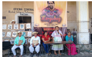
Foto 5. Visita de Marichuy, vocera del Congreso Nacional Indígena (CNI), a Huehuetla. Oficinas de la OIT. Noviembre 2017.

Algunos años después, con el fin de retomar estos procesos de reflexión e intercambio, se realizó el Primer Encuentro de Procesos Educativos Comunitarios en el CESIK en octubre del 2015, con la participación del BTENC, seguido por el Encuentro de Experiencias de Enseñanza-Aprendizaje en abril del 2016 en Tzicuilan. En las mesas de discusión que ahí se dieron, surgió la propuesta de vincularnos con otros bachilleratos alternativos, comunitarios e indígenas, lo cual llevó a la conformación de una red de Bachilleratos Disruptivos que busca nuevamente compartir experiencias y estrategias pedagógicas, al igual que recursos autogestivos para fortalecer la autonomía educativa. A raíz de esa iniciativa, recibimos a otras escuelas y organizaciones para el Segundo Encuentro de Procesos Educativos Comunitarios: Modelos y Estrategias de Enseñanza en mayo del 2016 y el Encuentro Nacional de Bachilleratos Disruptivos en junio del 2018 en las instalaciones del CESIK, eventos coordinados y llevados a cabo en gran medida por los estudiantes mismos. De la misma manera, se llegó a participar con todos los estudiantes y profesores del CESIK en el Tercer Encuentro Nacional de Bachilleratos Disruptivos: Educación y Transformación Social en marzo de 2019, en las instalaciones del Centro de Desarrollo Educativo Zacatelco (CDEZ) en Zacatelco, Tlaxcala.