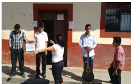
Fotos 3-4. Artificio del Taller de Conciencias.