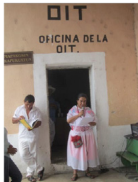
Foto 2. Profesores y egresados del CESIK participan en actividades del XXVI Aniversario de la OIT, 22 de julio de 2015.

En ese periodo, las iniciativas para retomar el vínculo directo con los procesos culturales y autoorganizativos de la comunidad fueron instrumentales para revivir el espíritu comunitario del proceso educativo. Entre 2008 y 2014 se vio la participación de la escuela en actividades rituales y ceremoniales realizadas por el Consejo de Ancianos, talleres organizados por el Juzgado Indígena y la Pastoral Social, faenas y asambleas en la OIT, y la realización de la mayordomía del santo patrón San Salvador en las instalaciones del CESIK. Además, se impulsó mucho la integración de los estudiantes a los cargos y servicios comunitarios en la iglesia, a las danzas tradicionales y tríos musicales. Estas actividades generaban convivencia con un círculo más amplio de integrantes de la comunidad, entre ellos socios y socias de la OIT, padres y madres de familia, egresados y egresadas, muchos de los cuales también eran danzantes, músicos, albañiles, campesinos o expertos en los oficios locales. Así, se motivaba tanto a los estudiantes como colaboradores a intercambiar con ellos saberes e historias y practicar formas de relación y colaboración basadas en la tradición y las costumbres del pueblo.