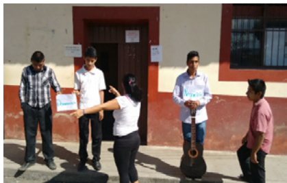
Fotos 3-4. Artificio del Taller de Conciencias.