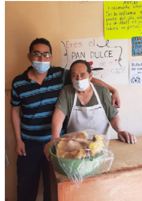
Fotografía: María del Rosario Fernández López (2022).

Maestro Panadero e hijo. El oficio de panadero es transgeneracional, heredando recetas y procedimientos que quedan como legado familiar