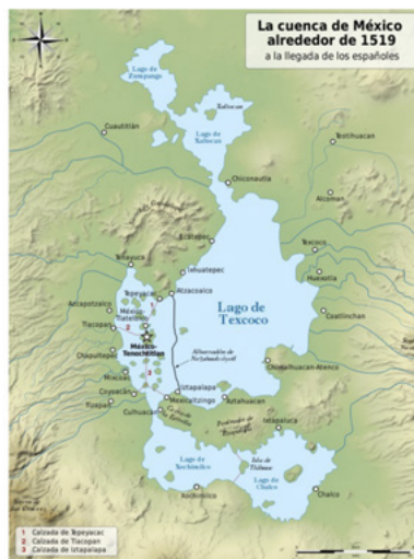
Figura 1. Ubicación de Aztahuacan, 1519

Santa María Aztahuacan es uno de los 15 pueblos originarios de la alcaldía Iztapalapa. Su topónimo deriva de la unión de los vocablos náhuatl, aztatl (garza), hua (partícula posesiva) y can (lugar), “lugar de los que poseen garzas” o “lugar de garzas”. Aztahuacan se fundó en la parte salada del Lago de Texcoco, de tal forma que sus principales actividades de subsistencia fueron el aprovechamiento de tequesquite, la caza de patos, la pesca en el lago, la agricultura y la extracción de tezontle (Gomezcésar, 2011).