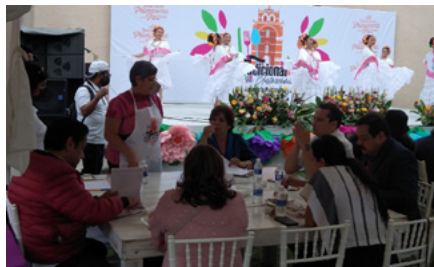
Nota. Momento del concurso gastronómico. 2022. Fotografía MIRG

En muchas ocasiones, las cocineras que participan en la muestra y en el concurso de rescate tienen un vínculo con las personas que forman parte del jurado: las madres o abuelas de los participantes, en no pocas ocasiones, trabajaron o aprendieron los platillos en las cocinas de las madres de quienes componen el jurado, lo cual nos remite al tema de la servidumbre y relaciones de poder que son propias del ámbito de las relaciones humanas del espacio social de la alimentación. Es en este espacio social donde observamos que la disputa por la originalidad de las recetas que aparecen en dicho concurso y la impronta de valores y emociones ligadas a las prácticas cotidianas de alimentación encuentran su valoración dentro de un ritual de legitimación y valoración de las posiciones de los agentes dentro de un campo de relaciones sociales.