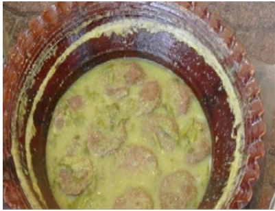
Fotografía: Mayte Viviana Guadalupe Pérez Cruz, 2017

En la cocina tradicional prehispánica el pato fue un elemento gastronómico muy deseado. Durante la Colonia, los hacendados le prohibieron a los pueblos de la ribera cazar patos. Siglos después, el comercio de patos se convirtió en una de las principales actividades económicas del pueblo. En Aztahuacan los recursos obtenidos de “las armadas”, nombre popular para referirse a la cacería de patos de la laguna, eran de carácter comunal (Trejo, 2017). De hecho, la construcción del icónico reloj erigido a un costado de la iglesia en la plaza central del pueblo fue posible gracias a esta actividad (Grupo Cultural Ollin, 2007).