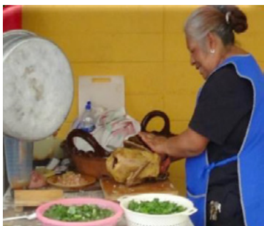
Fotografía: Mayte Viviana Guadalupe Pérez Cruz, 2017