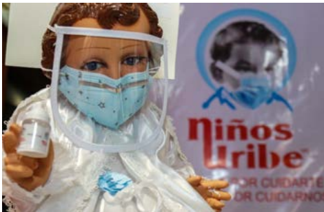
Figura 1. Niño Dios con cubrebocas, careta y alcohol hidrolizado.

Lo mismo sucedió en el Día de la Candelaria el 2 de febrero, en donde los Niños Dios vestidos de doctores, enfermeros, internistas, todos con cubrebocas fueron a ser bendecidos. Al mismo tiempo, su presencia en las casas hacía creer que se mitigaba el contagio del coronavirus entre los miembros del hogar.