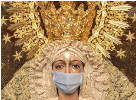
Figura 7. Virgen con cubrebocas