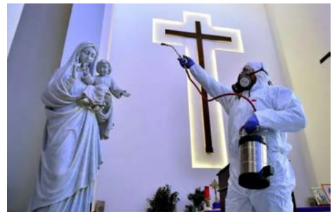
Figura 9.