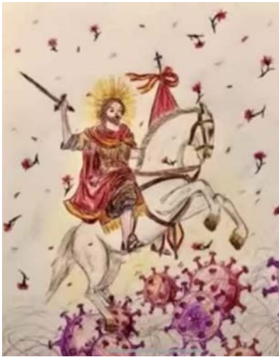
Figura 4. Dibujo del Santo Señor Santiago que se enfrenta al COVID

En el mismo tenor, se hacía presente en las redes la imagen de Santiago Mata COVID, una atribución más a San Santiago dentro de su hagiografía, pues es considerado como protector ante las amenazas del mal y también ayuda a enfrentarse a los malos temporales. En este caso, combate la amenaza del coronavirus y los malos tiempos que la pandemia conlleva. Según Olaya Sanfuentes (2020) hay una intrínseca relación entre religión, rituales, protección y ciencia a raíz de esta imagen, variante en donde originalmente se le muestra combatiendo a musulmanes.