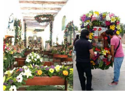
Figuras 11 y 12: Interior de la Iglesia y salida del Divino Rostro, julio 2020.

del Divino Rostro en auto fue completamente aislado.