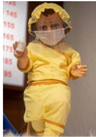
Figura 2. Niño Dios internista