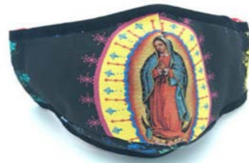
Figura 5. Mascarillas con imágenes de la Virgen

Los cubrebocas con imágenes católicas salieron a comercializarse al por mayor, siendo considerados como un escudo de sanidad para las personas creyentes, especialmente por proteger nariz y boca. Las demandas solicitadas eran las imágenes de la Virgen de Guadalupe, Jesucristo y San Judas, por señalar algunas, de venta en las tiendas de objetos religiosos, pero también sobre pedido a quienes se dedicaron al comercio de este artículo de primera necesidad.