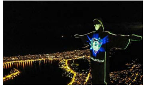
Figura 8. El Cristo Redentor, Río de Janeiro, Brasil. El Cristo Redentor de Río de Janeiro luce una máscara proyectada en su rostro para concienciar a la población de la importancia de su uso durante la pandemia de coronavirus este domingo, en Río de Janeiro (Brasil). Fotografía: EFE, Coronavirus en Brasil: Cristo Redentor se pone mascarilla para concienciar a población. (04 de mayo de 2020). Andina. https://andina.pe/agencia/noticia-coronavirus-brasil-cristo-redentor-se-pone-mascarilla-para-concienciar-a-poblacion-795769.aspx