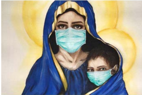
Figura 6. Virgen protectora del Coronavirus