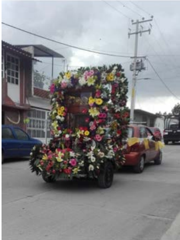
Figura 10: Trayecto del Divino Rostro, julio 2020.

algunos autos con las personas que querían acompañar en la procesión.