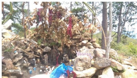
Figura 2. Petición de lluvias en Cuanacaxtitlán, 2019