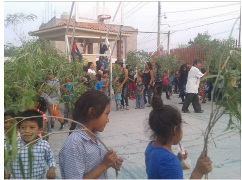
Figura 4. Danza de las Ramas, Xoxocotla Morelos 2019

dose de derecha a izquierda, simulando el movimiento de una serpiente. Esta danza, es la socialización de la respuesta de la cueva, y sea cual sea el destino del temporal, la danza sella el cumplimiento