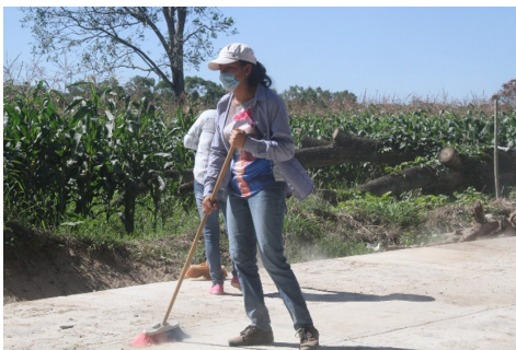
Imagen 4. La milpa y el trabajo comunitario. ISIA, 05/02/2020.

Como se denota, el ingreso percibido bajo el sistema neoliberal no proporciona una mejor calidad de vida, al contrario, alienta la pobreza, pues la regla es “tener dinero y luego comida” (Torrez 2008, p. 97). Cuando la lógica en la comunidad nos dice que desde antaño la milpa y los huertos proveían los alimentos del consumo familiar.