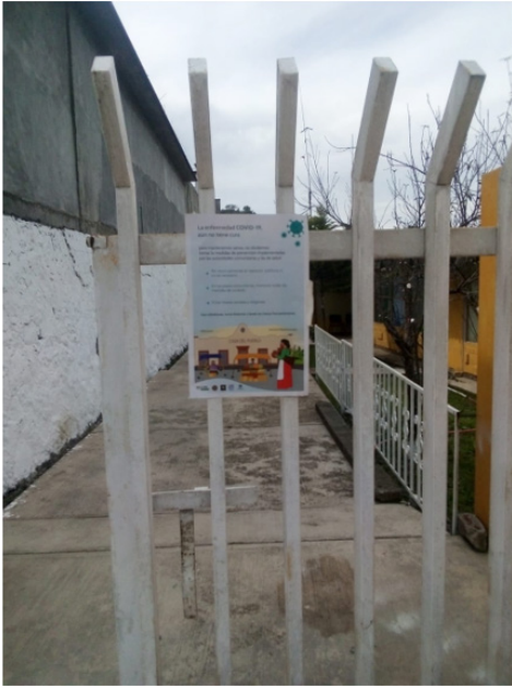
Imagen 3. Difusión de medidas/Maricela Ramos, San Andrés Chicahuaxtla