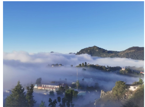
Imagen 1. Yuma' niko./ San Andrés Chicahuaxtla, Putla Villa de Guerrero, por Misael Hernández 25/01/2021

Para realizar el trabajo agrícola han de considerarse los calendarios locales de modo acorde a los principios y conocimientos de las comunidades. Albores (2002) manifiesta que desde tiempos prehispánicos la agricultura que depende de la lluvia estival, llamada en México de temporal, era sin duda la dominante de Mesoamérica. Era la que probablemente ocupaba un área mayor y en la que se producía la mayor parte del abasto de las poblaciones campesinas prehispánicas. Hoy en día la revalorización de la agricultura de temporal y otras técnicas de cultivo permiten distinguir los procesos para el abastecimiento de alimentos en pueblos indígenas de sociedades contemporáneas.