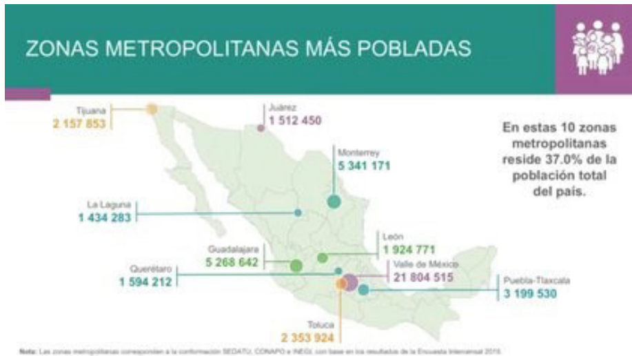
Imagen 1. Zonas Metropolitanas más pobladas de México.