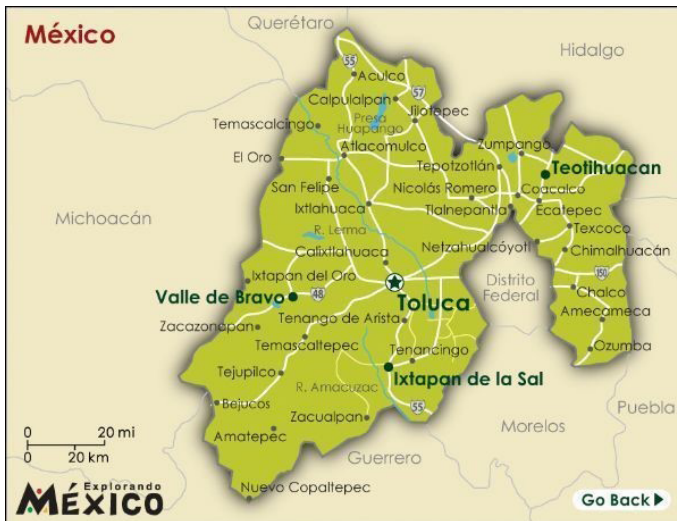
Imagen 4. Mapa del Estado de México con referencias de algunos municipios. Fuente: Explorando México. Detalle. Disponible en: http://edomex.gob.mx/municipios_mexiquenses