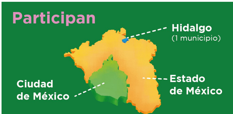
Imagen 2. Zona Metropolitana del Valle de México. Fuente: Consejo para el desarrollo metropolitano. Gobierno de la Ciudad de México.

Disponible en: https://www.infobae.com/america/mexico/2021/01/25/censo-2020-estas-son-las-tres-entidades-con-mayor-poblacion-en-mexico/