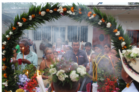
Figura 4: En las afueras de la casa se recibe al grupo que ha regresado de la visita al sitio sagrado, ellos traen la semilla.

El grupo que se reunió para esperar en la casa del especialista hace las contestaciones acerca de lo que va diciendo el especialista ritual, agradecen a los santos, los regentes de los cerros, al tata y la nana de la tierra, por permitir que todos hayan regresado con bien. La música ritual de instrumentos de cuerda y banda de viento acompaña este momento, de ambos lados de la mesa se escuchan sonos que complementan el ritual.