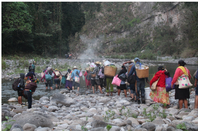
Figura 2: En el recorrido, la gente cruza ríos, arroyos, sube montañas, se interna en cafetales, atraviesa potreros y a veces otras comunidades para llegar al destino deseado.