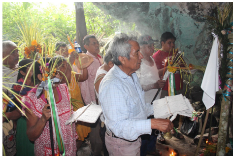
Figura 3: El especialista ritual se presenta ante la mesa principal para iniciar la ofrenda a las antiguas que habitan el sitio sagrado y firmar los muñecos de papel.

En algunos casos el grupo puede permanecer un día y una noche en el lugar, sin embargo, hay sitios donde es necesario estar más o menos tiempo, ya que se tiene que atender cada uno de los niveles y ofrendar en las mesas que componen el lugar.