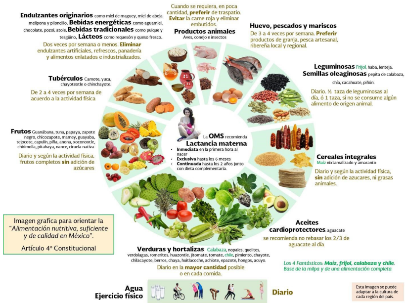
Figura 1. Imagen gráfica de la dieta de la milpa (Almaguer González J. A., et al, 2019, p. 40).