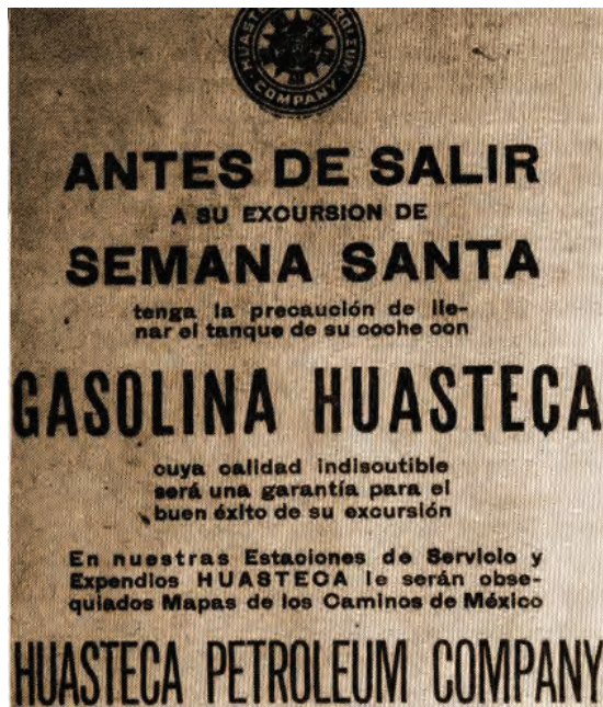
Figura 1. Cartel de promoción de la gasolina huasteca.