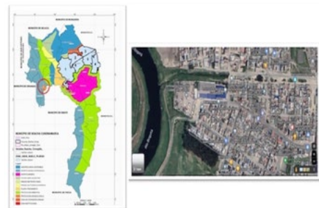
Figura 1. Mapa de localización general de Soacha y en detalle comuna uno.