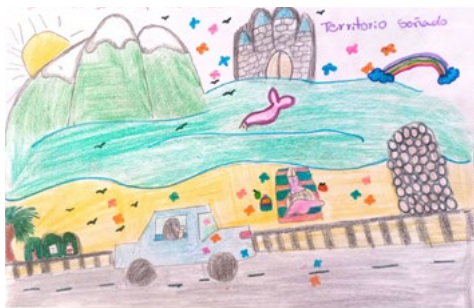
Figura 6. Representación pictórica del territorio soñado para la estudiante Camila.