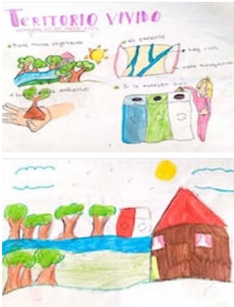
Figura 2. Representación del territorio vivido para Natalia