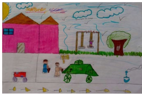
Figura 4. Representación del territorio vivido para Carmen.

La identidad territorial que Camilo deja ver en su representación indica que en el territorio vivido han dejado huella en él, tanto los componentes ecosistémicos de la ruralidad como las prácticas ambientales de gestión de residuos orgánicos, producto de acuerdos con su vecino. Aquí se observa un sentido proactivo protagonista de Camilo en el territorio vivido relacionado con sus prácticas de cuidado, así como las relacionadas con la construcción colectiva de procesos de tratamiento de desechos orgánicos.