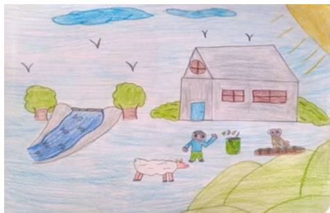
Figura 3. Representación del territorio vivido para Camilo.

idea de calidad, así como la de abundancia y su lugar de acción en las prácticas ambientales, evocando una huella de carácter proactivo.