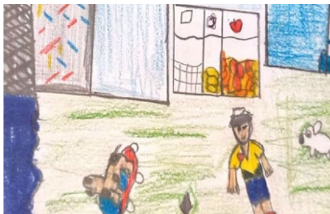
Figura 5. Representación pictórica del territorio soñado para Mario.

En estas representaciones sobre el territorio soñado, los estudiantes demuestran una mezcla entre experiencias dadas a partir de los territorios vividos con sus expectativas y la constitución de una identidad territorial individual. Dadas las limitaciones en cuanto al número máximo de imágenes a incluir en este artículo, en adelante se exponen los tres casos más significativos sobre estas representaciones.