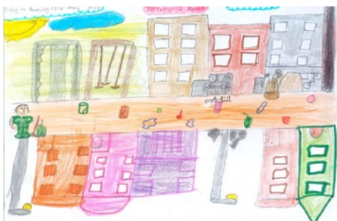
Figura 8. Representación pictórica del territorio real para Luciana.