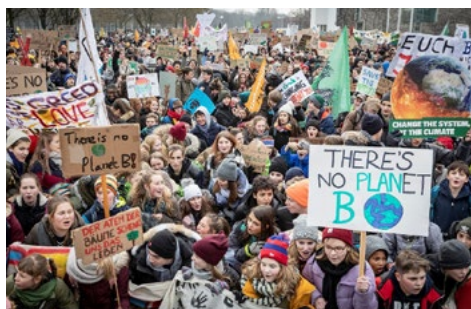
Fig. 3. Manifestación Viernes para el futuro (Berlín, 25 de enero de 2019)

Nota. Adaptado de Fridays for Future , de Jörg Farys, 25 de enero de 2019, Fuente: FridaysForFuture Deutschland. CC BY 2.0.