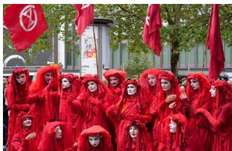
Fig. 2. Brigada Rebelde Roja en manifestación de Extinction Rebellion (Berlín, 9 de octubre de 2019)

Nota. Adaptado de Red Rebel Brigade bei einer Kundgebung am Kurfürstendamm von Extinction Rebellion am 9. Oktober 2019 , de Leonhard Lenz, 9 de octubre de 2019, Fuente: Wikimedia Commons. Creative Commons CC0 1.0 Universal Public Domain Dedication.