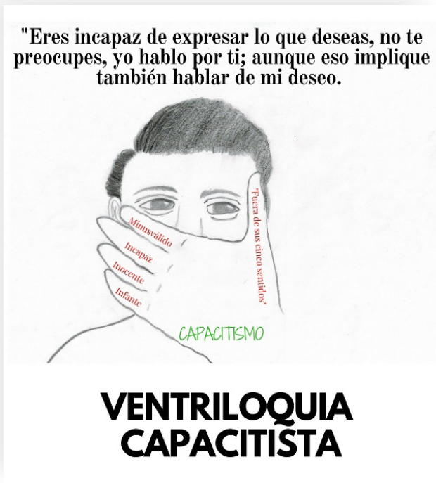
Ilustración 1. Fanzine ¿Quién habla por?, 2018, Jhonatthan Maldonado Ramírez.

Consecuentemente, me niego a ser el ventrilocuo de mi hija, me niego a percibirla a través de expectativas ajenas a su deseo, me niego a brindarle un cuidado paternalista, me niego a considerarla minusválida, me niego a someterla al diagnóstico socio-clínico del síndrome de Down, me niego a ser el soberano que decide sobre su trayectoria de vida, me niego a capturarla en la indefensión, así como me niego a dejar de lado nuestra inevitable interdependencia.