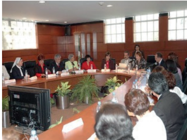
Fotografía 2. Sesión de instalación de la Comisión Permanente de Enfermería.